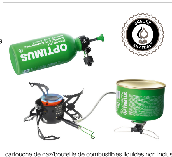
cartouche de gaz/bouteille de combustibles liquides non inclus

Poids : 330 g (sans pompe) 475 g (pompe comprise) Dimensions : 140 x 80 x Ø 65 mm Garantie : 2 ans Matériaux : Acier, cuivre et aluminium inoxydables Accessoires : Une pompe FLIPSTOP™, Multitool, un pare-vent, un réflecteur de chaleur, une housse, des pièces de rechange et le lubrifiant Référence article : 8019229 Optimus Polaris Optifuel GTIN-13 Code: 7612013192295 GTIN-14 Code: 10604375192291 (6 pièces)